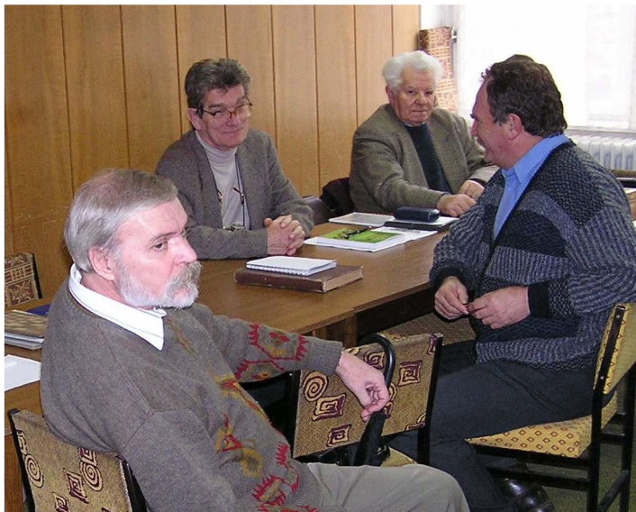
Jeles perfin gyűjtők a társaságban