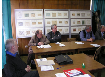
Céglevelek kiállítási keretekben