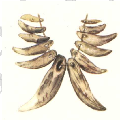
Őskori harcos nyaklánc 1

Maga a gyűjtés – gyűjtögetés – története visszanyúlik az őskorba. Az ősközösség kezdetén elődeink táplálékukat gyűjtögetéssel szerezték meg. Valószínűleg már ekkor is felfigyeltek egy-egy szebb csigaházra, kődarabra, amikből később „nyakéket” készítettek. Egyfajta társadalmi elismerést jelentett ekkor egyes, az emberi közösségre veszélyt jelentő ragadozók elejtése. Amellett, hogy az ősi harcos ezzel bátorságáról tett tanúbizonyságot, hússal is ellátta a horda tagjait. Bátorságát és hőstetteit a harcos a ragadozó trófeájának – rendszerint szemfogának – „nyakláncra” fűzésével hozta társai tudomására. Minél több trófeája volt, vagy azok minél félelmetesebb állattól származtak, annál nagyobb volt a tekintélye a vadásznak.