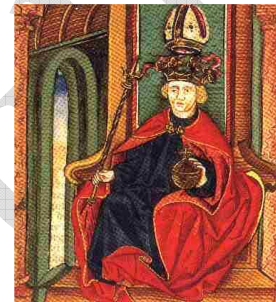
Könyves Kálmán király 10