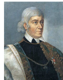
Gróf Széchényi Ferenc 12