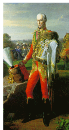
I. Ferenc 7