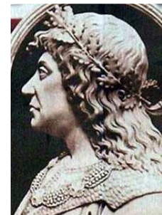
Mátyás király 11