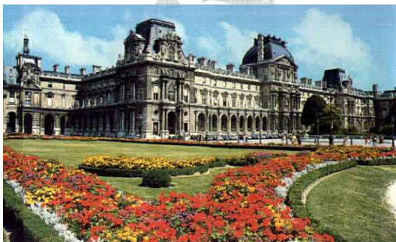
Louvre - Párizs 4

A XVI. században I. Ferenc francia királyt (1494-1547) kell megemlítenünk, aki a jelenlegi egyik legjelentősebb gyűjteménynek otthont adó múzeumnak, a párizsi Louvre -nak az alapítója volt. A Louvre első épületében 1546-ban helyezte el akkori gyűjteményét: festményeket, könyveket, szobrokat stb.