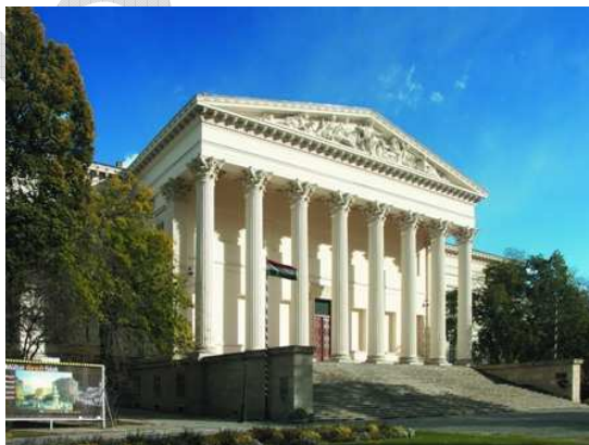
Magyar Nemzeti Múzeum 8

A XIX. században gróf Széchényi Ferenc (1754-1820) gyűjtői munkássága emelkedett ki, aki 1802-ben megalapította a Magyar Nemzeti Múzeum és Könyvtárát (ez utóbbiból lett az Országos Széchényi Könyvtár ), és amelynek odaajándékozta gyűjteményét.