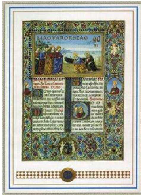
Mátyás király misekönyve – bélyegblokk

Magyarországon az első között Könyves Kálmán (1074-1116) királyunk volt az, akit műveltsége miatt neveztek kortársai „Könyvesnek”. A középkor legjelentősebb gyűjtője Mátyás király (1443-1490) volt, akinek könyvtára , a Corvina a legszebb könyvtár volt saját korában a maga 2500 kötetével, de Mátyás a könyveken kívül minden művészeti alkotást gyűjtött.