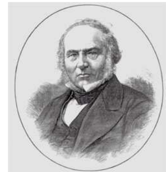
Lord Rowland Hill 2

A korabeli angol postai viszonyokat látva írta meg „A postai rendszer szükségessége és fontossága” című munkáját. Ebben az időben Angliában a posta elfogadott olyan küldeményeket is, amelyeknél a viteldíjat a címzettnak kellett fizetnie. Ez a lehetőség egyre több visszaélésre adott alkalmat. A feladó a címzettel előre megbeszélte jeleket írt a borítékra. A címzett a kézbesítés alkalmával le tudta olvasni ezeket a borítékról, majd utána a levél átvételét és a viteldíj kifizetését megtagadta. Ugyanígy gyakran megfizetetlen maradtak a címzett bosszantására vagy megtréfálására feladott küldemények is.