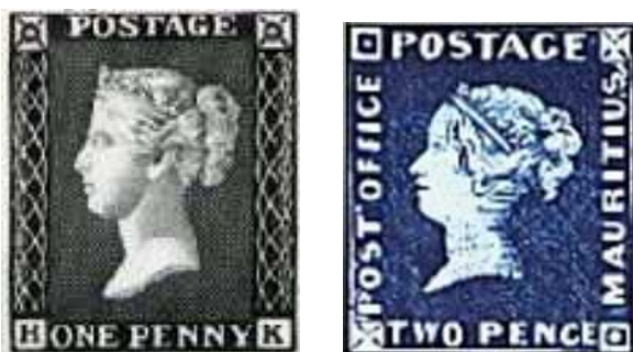
Az első bélyegek: fekete 5 , kék 6 pennyk

A reformtervezet eleinte erős ellenállásba ütközött a konzervatív Angliában, de Hill kitartó harccal végül is el tudta fogadtatni tervezetét. 1840. május 6-án forgalomba került a fekete színű 1 penny és a kék színű 2 penny értékű bélyeg a fiatal Viktória királynő portréjával.