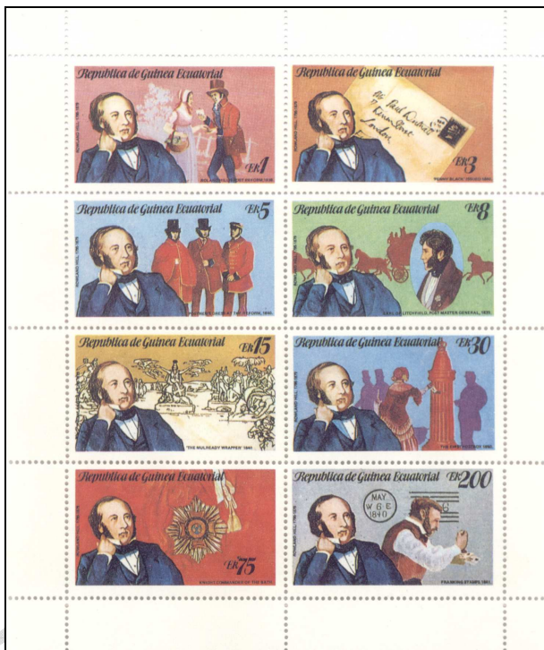
Rowland Hill emlékére kiadott blokk 1

Ma egyértelműen elfogadott, hogy az angol Rowland Hillt tekintik a bélyeg atyjának.