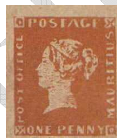
Egy év múlva megjelentették az ún. „vörös” pennyt 8 is.