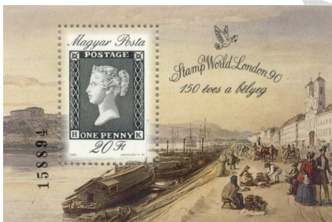
150 éves a bélyeg - blokk 7

A reform bevezetését követően Angliában fellendült a postai forgalom, majd Anglia után előbb Európában, majd a tengeren túl is egyre több ország adott ki bélyegeket.