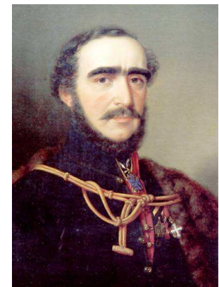
Gróf Széchenyi István 14