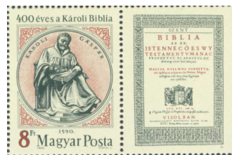
400 éves a Károli Biblia 9

A kezdetek óta mind hazánkban, mind a világon számos szelvényes bélyeg jelent meg.