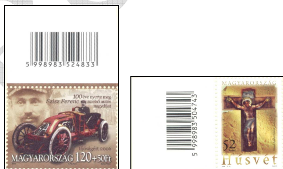
Ifjúságért: 100 éve nyerte meg Sziisz Ferenc az első autós nagydíjatbélyeg és Húsvét bélyeg 2

2000-től a magyar posta a bélyegkészletek nyilvántartásának megkönnyítése céljából bevezette a vonalkódok használatát a bélyegíveken.