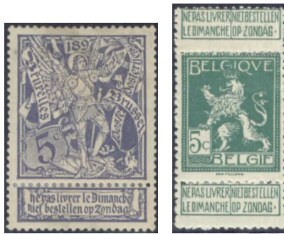
Belga bélyegek vasárnapi kézbesítési ívszegéllyel 5

Így a feladó a szelvény érintetlenül hagyásával jelezni tudta, hogy nem kívánja a vasárnapi kézbesítést, mert ez a címzett keresztény elveit sértené. Ahol ilyen vetülete nem merült fel a kézbesítésnek, ott a feladó letépte a szelvényt.