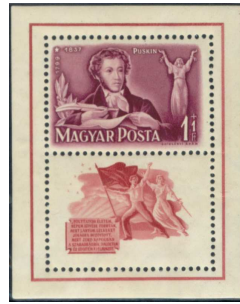
A Puskin blokkpár fogazott blokkja 8

A magyar posta által kiadott első perforációval elválasztott szelvényes bélyeg az 1949-es „Puskin” blokkpár fogazott változatában került kiadásra.