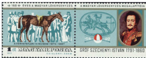
150 éves a magyar lóversenyzés 10