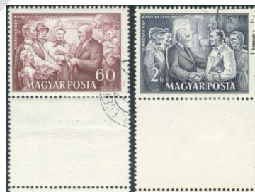
Rákosi 60 filléres és 2 Ft-os üresmezős bélyeg 11

A szelvény és az ívszél keveréke az „üres mező”. Ez akkor jön létre, ha az ívszél a bélyeg méreténél szélesebb és a fogazógép a bélyegképmezőn kívül is leüt. Magyar bélyegeknél először az 1949-es „Petőfi” sorozatnál fordult elő üres mezős bélyeg. Ezt követően az 50-es években gyakran keletkeztek ilyen bélyegek, melyek kedvelt gyűjtési területet képeznek.