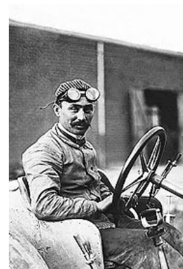
Sziisz Ferenc a világ első Grand Prix győztese (magyar származású, szeghalmi születésű versenyző) 4