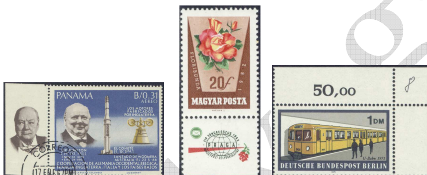
Különböző ívszegélyű bélyegek 1

Az ívszélien található jelek lehetnek lemezszámok, illesztő jelek, színpróbák, gyártási időpontok, összegző számok, forgalomban tartási időpontok, sőt, akár hirdetések is.