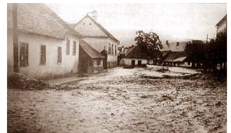
1913-as árvíz 7