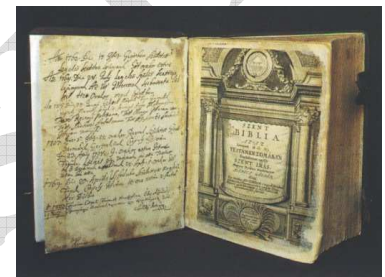
Károli Gáspár Bibliája 13