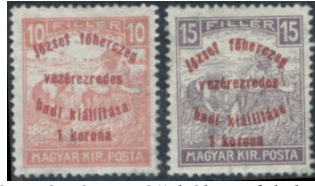
„Fehér számú arató” bélyeg felünyomva 4

1917-ben a margitszigeti hadikiállítás megörökítésére az 1916-ban kiadott „Fehér számú arató” bélyegeket nyomtatták felül a „ József főherceg vezérezredes hadi kiállítása 1 Korona” szöveggel.