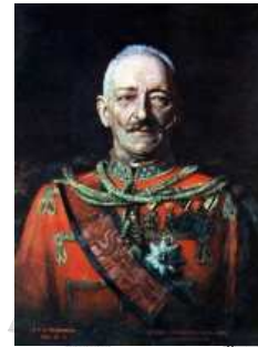
József főherceg 8

Az első felünyomott bélyegek óta számos ország szinte megszámlálhatatlan bélyeget adott ki az eredeti bélyeg módosításával, amely tény erősen ösztönzi a bélyeghamisításokat, mivel a felünyomott bélyegek gyakran jóval értékesebbek az eredetnél.