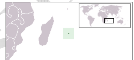
Mauritius elhelyezkedése 3

Hadisegély: az I. világháborúban elesett magyar katonák özvegyeinek, árváinak megsegélyezése szánt összeg.