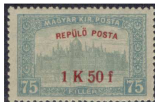
„Repülőposta” bélyeg 2

A rendeltetés megváltoztatására példa az 1916-ban kiadott 75 filléres és 2 Koronás parlamentes bélyegek „REPÜLŐ POSTA 1K 50 f” és „REPÜLŐ POSTA 4K 50 f” felirattal való megváltoztatása. Ezzel a korábbi forgalmi bélyegeket a Budapest – Bécs – Krakkó – Lemberg között közlekedő légiposta számára nyomtatták felül. Ezáltal a bélyegek névértékét is megváltoztatták.