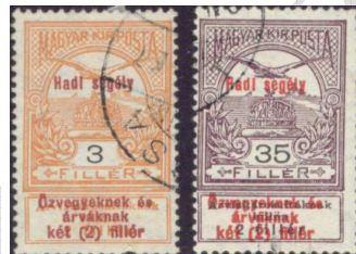
Első felülnyomott magyar bélyegsorozat két bélyege 1

Magyarországon az előbb felsorolt valamennyi cél érdekében nyomtak felül bélyegeket. Az első felülnyomott bélyegeket 1914-ben bocsátották forgalomba. A korábban kiadott „Árvíz” bélyegek címleteit nyomták felül „ Hadi segély Özvegyek és árváknak két (2) fillér” szöveggel, ezáltal kötelezve a bélyeg megvásárlóit a jótékonykodásra.