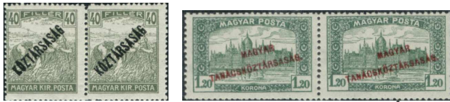
Felünyomott bélyegek rendszerváltozás miatt 5

A magyarországi politikai változásokat örökítik meg az 1918-ban kiadott KÖZTÁRSASÁG és az 1919-es MAGYAR TANÁCSKÖZTÁRSASÁG felünyomatú bélyegek.