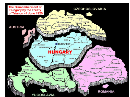
Elcsatolt területek 9

Tanácsköztársaság: sajátos államforma, amelyben a hatalmat elvileg a közvetlenül választott tanácsok gyakorolják. A proletárdiktatúrának nevezett hatalmi rendszer egyik formája. A „tanácsköztársaság” kifejezés az 1917-es oroszországi forradalom idején született, a magyar szó az orosz szovjetrepublik fordítása ( szovjet = „tanács”).