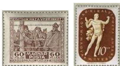
Hadifogyó és Művész sor egy-egy bélyege 6

Hazánkban az előbb ismertett célok mellett még számos okból adtak ki feláras bélyeget: hadifogylok hazautazásának támogatása, művészetek támogatása.