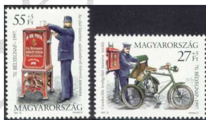
1997. évi bélyegnapi sorozat 11

Az utóbbi időben a posta a bélyegnapi bélyegek felárát az ifjúsági bélyeggyűjtés támogatására fordítja.