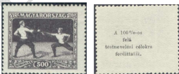
A „Sport I.” sorozat egy bélyegének mindkét oldala 2

Az 1924-ben megjelent „Sport (I.)” sorozat bélyegeinek hátoldalára nyomtatták (kivételes módon) a felárral kapcsolatos tájékoztatót „A 100 %-os felár testnevelési célokra fordíttatik”.