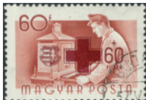
1956 – Vöröskereszt feláras bélyeg 1

A bélyegek felárait rendszerint valamilyen nemes célra fordítják, amire az államnak – mint bélyegkibocsátónak – nincs elég pénze.