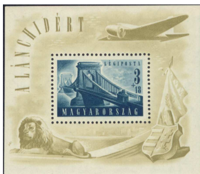
Lánchíd blokk 9

1948-ban a németek által felrobbantott Lánchíd újjáépítése támogatására fordították a „Lánchíd” blokk felárát.