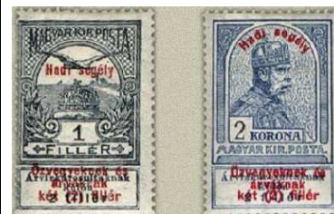
Hadisegély (I.) 4