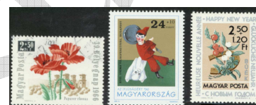
Feláras bélyegek 8

A Magyar Vöröskereszt: a Jean Henri Dunant kezdeményezésére létrejött Nemzetközi Vöröskereszt magyarországi szervezete, amely 1881. május 16-án alakult Esztergomban Magyar Szent Korona Országai Vörös-Kereszt Egylet néven. Természeti vagy más katasztrófa helyzetben segélycsapatokat működtet, segíti a menekülteket. Közreműködik eltűnt személyek felkutatásában, segíti hazatérésüket. Egészségneveléssel, házigondozószolgálat kialakításával, elsősegélynyújtás-oktatással hozzájárul az élet- és egészségvédelemhez. Háború esetén szerepet vállal a rászoruló mentésében, nyilvántartásában. Véralásszervezés