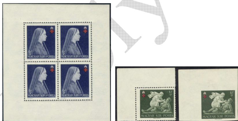
„Vöröskereszt I.” sorozat kisíve, a „Vöröskereszt II.” sorozat egy bélyege fogazott és vágott kivitelben 7

1942-ben a Vöröskereszt I. és II. sorozat felárat a Magyar Vöröskereszt támogatására fordították a világháborús tevékenység folytatása céljából.