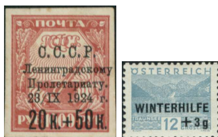
Szovjet és osztrák feláras bélyegek 5

Később az egész világon elterjedt, hogy a felárat a bélyeg névértéke után + jellel tüntetik fel.