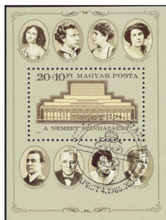
A „Nemzeti Színházért” blokk 10

1986-ban, a korábban lerombolt Nemzeti Színház újjáépítésnek támogatására adtak ki 20+10 Ft névértékű bélyegblokkot.