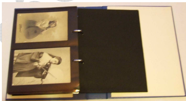
Képeslap berakó 1

A megtartani kívánt borítékokat, levelezőlapokat és más postai objektumokat célszerű egy megfelelő méretű dobozba elrakni. Az értékesebb daraboknak lehet kapni különböző kivitelű, a bélyeg berakó könyvhöz hasonló levél-képeslap berakókat.