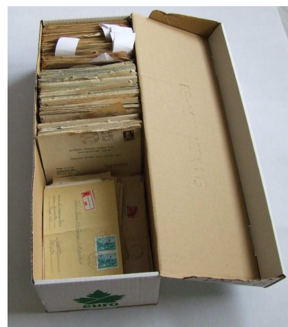
A tárolás egy lehetséges módja 2