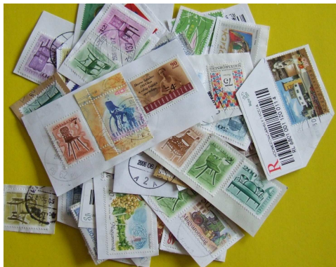
Áztatni való bélyegek 3

Azokat a borítékokat, amelyeken elmosódott a bélyegzés, a boríték gyűrött, hiányos stb. nem érdemes tárolni, ezekről célszerű a bélyeget leáztatni. Ezt a következők szerint tegyük! Vágjuk körül a bélyeget úgy, hogy 3-4 mm-re túl érjen rajta a papír.