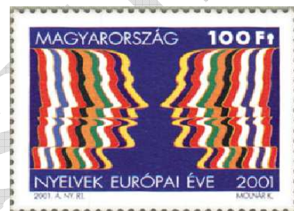
2001-ben kiadott első magyar bélyeg (a III. évezred első magyar bélyege) 5

A felsorolt gyűjtési területek csak példák. Ezeken kívül még számtalan módon lehet bélyeget gyűjteni. Vannak, akik vízjel szerint, nyomási eltérések alapján gyűjtik a bélyeget. Sokan gyűjtik településük postai dokumentumait, de gyűjtenek bélyegzéseket, ragjegyeket és minden olyan dolgot, amely a postai küldeményekkel kapcsolatos.